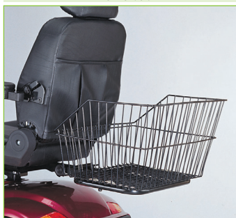
Košík (volitelné příslušenství)