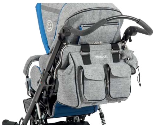
taška na vodítko