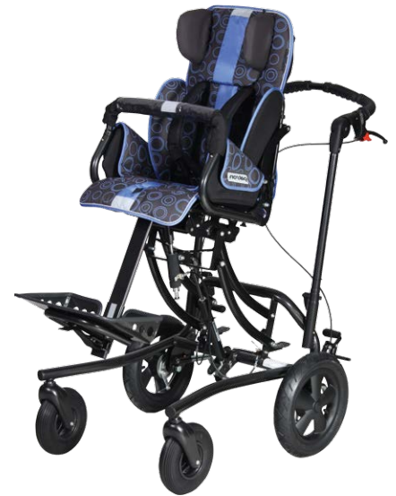
podvozek s nasazenou sedačkou