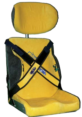
sedací ortéza + CSI rozhraní